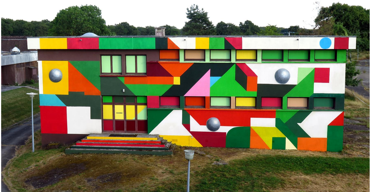
Le spectaculaire mur néo-géométrique de 10m x 24m réalisé par Debens pour Street Art City.

L'artiste urbain barcelonais Debens, installé à Paris depuis 2012, a fait partie des artistes invités à participer au projet Street Art City avec un spectaculaire mur solo de style néo-géométrique mesurant 10m x 24m . Debens a voulu s'adapter à la physionomie du bâtiment avec une création qui s'intègre parfaitement à sa structure et essaie de la rendre dynamique. Des figures tridimensionnelles, des circonférences qui flottent légèrement, des fausses perspectives, des ombres et des couleurs intenses font partie de cette composition colossale qu'il a réalisée en 4 jours de résidence avec de la bombe et de la peinture à l'eau.