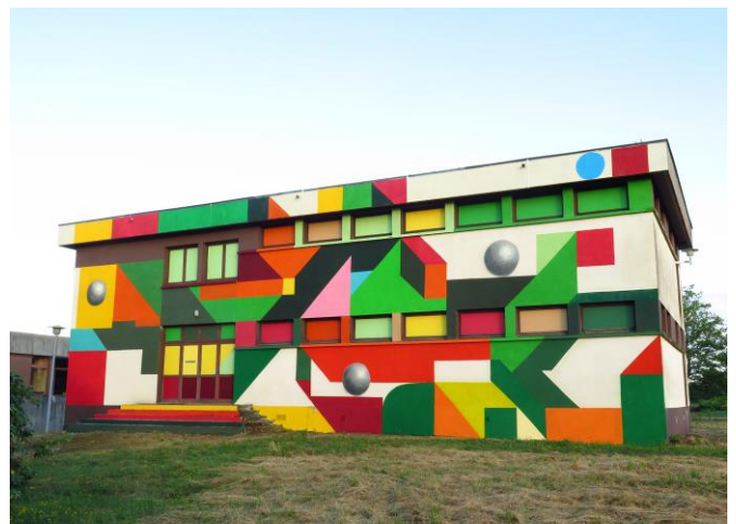
Le bâtiment, de deux étages, était à l'époque une salle de formation, avec une entrée principale et de nombreuses fenêtres.