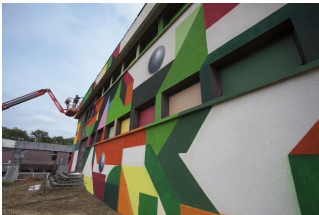
Le procès de création du mur de 10m x 24m. avec de la bombe et de la peinture à l'eau.